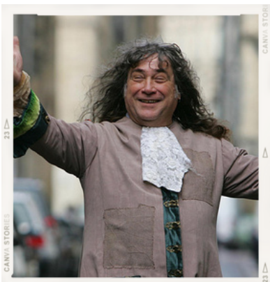
Écriture et mise en scène : Georges BERDOT